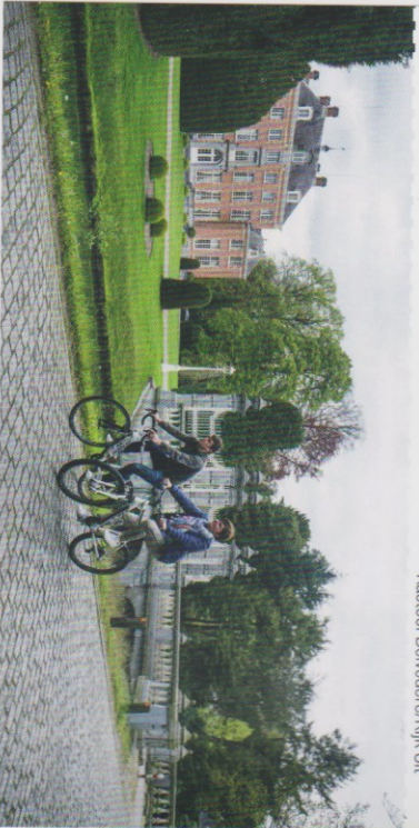
Kasteel Bevedere/Kijk Uit

In gemeentelijk domein Schildehof, waarvan de geschiedenis teruggaat tot de twaalfde eeuw, kom je spontaan tot rust. Je kuurt er door een aangenaam parklandschap met vijver, bloemen- en insectentuin en uitgestrekt bosgebied. Wandel zeker tot bij de Doodenstun. In deze renaissance tuin ontdek je kruiden die de Vlaamse plantkundige Rembert Dodoens al in de zestiende eeuw beschreef in zijn wereldberoemde 'Cruydeboeck'.