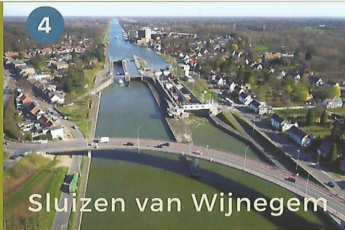
Sluizen van Wijnegem