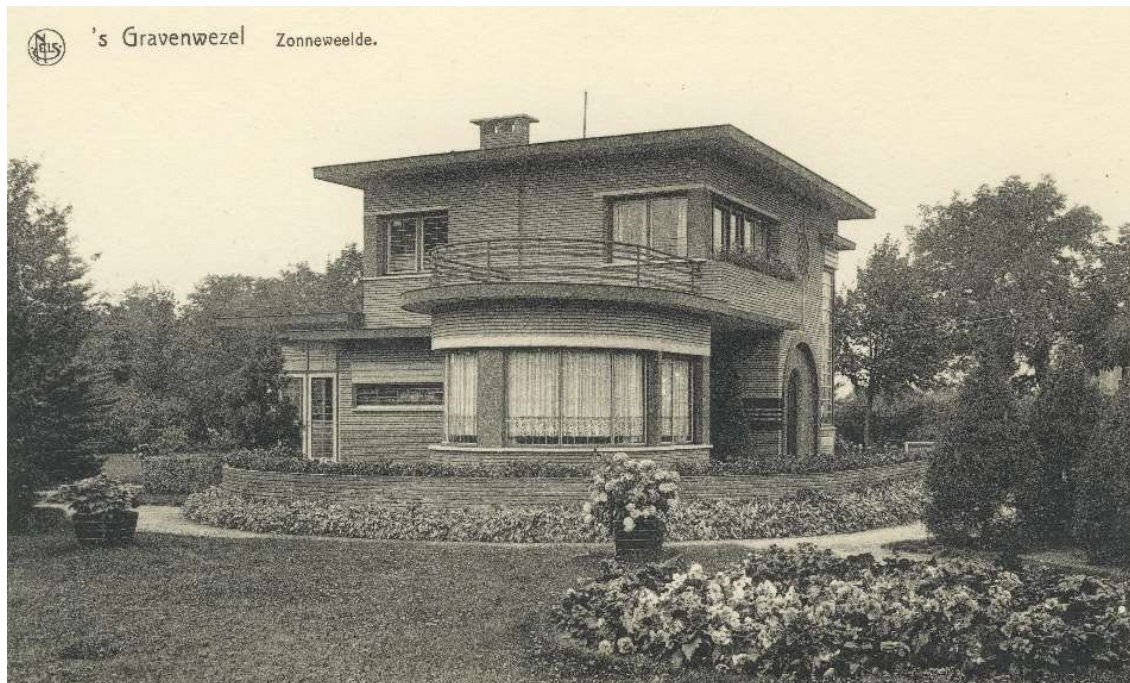
Woning burgemeester Borstlap in de Veldlei 84. Afgebroken in 2010.

Deze straat bezit/bezat een bonte verzameling van huizen in brave mengstijlen met mooie details uit allerlei bouwperiodes. Vooral rechts in het begin van de straat. Jammer genoeg verdwijnen ze in sneltempo door afbraak vaak omdat ze te klein zijn naar onze normen van vandaag of teveel grond hebben.