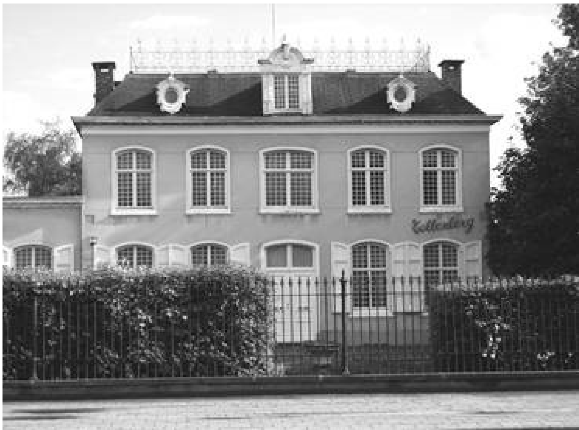
foto: Tollenberg, Turnhoutsebaan 180, 2 de helft 18 de eeuw. Voormalige notaris- en dokterswoning.

De hernieuwde interesse in de kunst van de klassieke oudheid was een reactie op de wollig-weelderige Barok en Rococo en het gevolg van belangrijke archeologische opgravingen en studies in die periode (vb. Pompeï). Kenmerkend zijn de zuivere vorm, rechtlijnigheid en harmonie, de symmetrisch ingedeelde, vaak witgepleisterde gevels en de toepassing van classicistische elementen als frontons, kroonlijsten, zuilen, pilasters e.d.