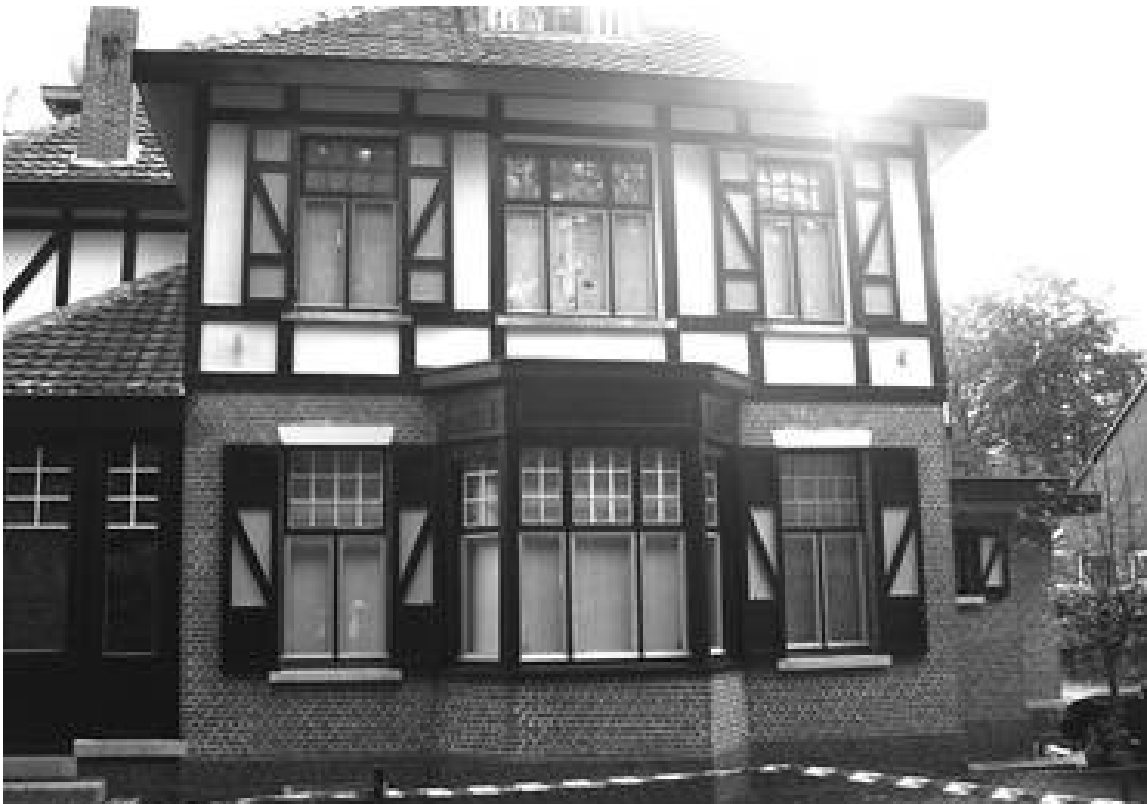
foto: het huis Molenhof huisnummer 11. In de Groenelaan zijn in totaal 16 woningen in cottagestijl of een variatie ervan.

Deze romantische neostijl deed het goed in onze natuurlijke omgeving en er zijn talrijke voorbeelden van terug te vinden.