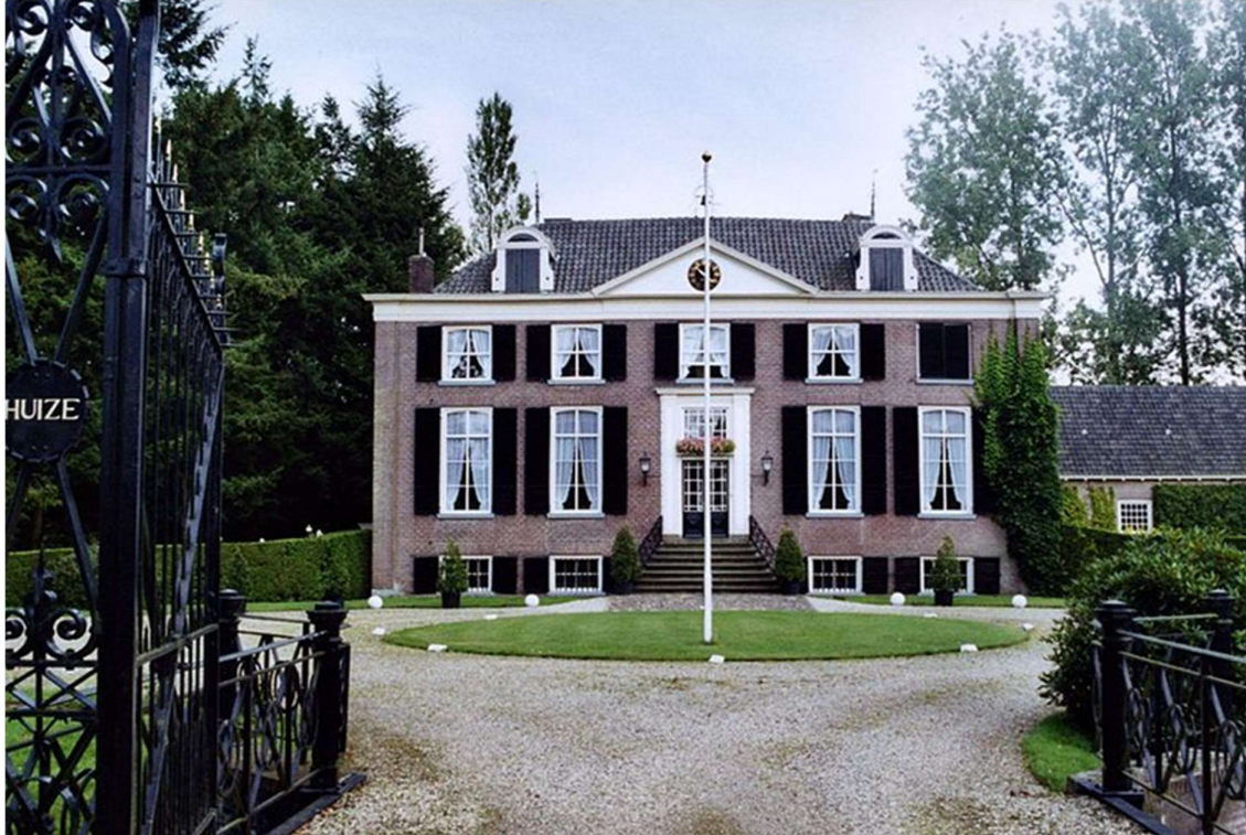
De foto is Huis 't Zelle in Hengelo te Gelderland.

rechts nr.11 een Nederlands hof, een look-a-like van een gekende Nederlands bouwstijl. Vooral in Gelderland en Friesland komt dit soort van 18 de en 19 de -eeuwse landhuizen erg veel voor. (zie foto op volgende pagina)